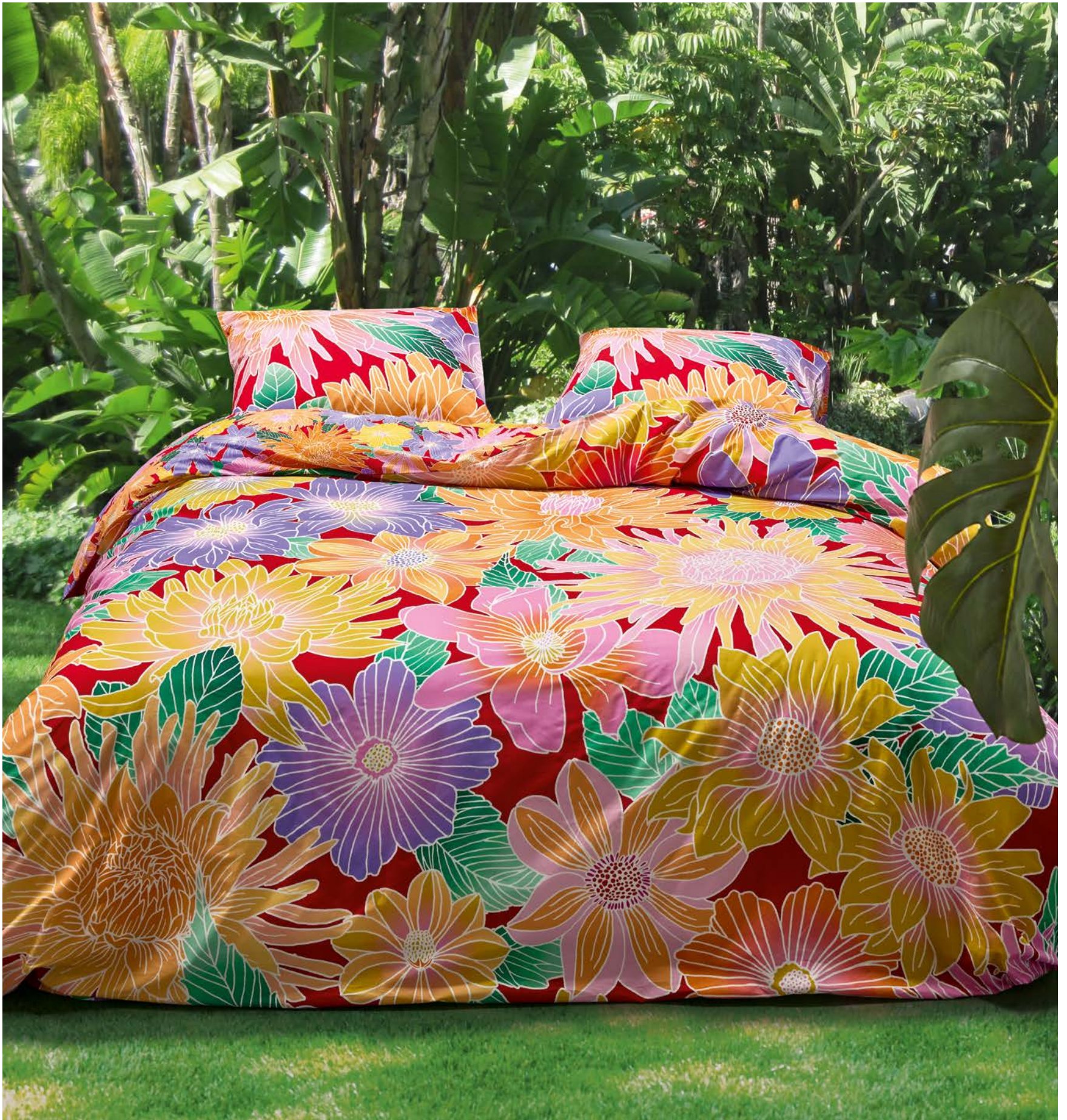
1. PERKAL-WENDE-BETTWÄSCHE ab 69,95 ESSENZA

1. PERKAL-WENDE-BETTWÄSCHE: Eine wunderschöne fantasievolle Blütenpracht zeigt die Vorderseite. Die Rückseite zeigt kleinere Blüten. Alles in leuchtenden, sommerlichen Farben – und das Ganze in herrlich weicher, hochwertiger Perkal-Qualität. Aus diesem Stoff sind traumhaft schöne Sommernächte gemacht. Aus 100 % Baumwolle. Mit Reißverschluss. 135 / 200 cm 69,95, 155 / 220 cm 89,95. 2. VELOURS-STRANDTUCH: Bunt gestreift und hübsch bedruckt mit den schönsten Urlaubsparadiesen – ein Strandtuch, das auffällt und echtes Summerfeeling verbreitet. Aus 100 % Baumwolle. 100 / 180 cm 29,95.