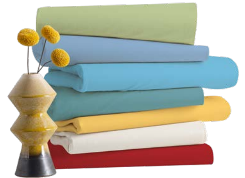
9. FROTTIER DORMABELL SPA ab 11,95