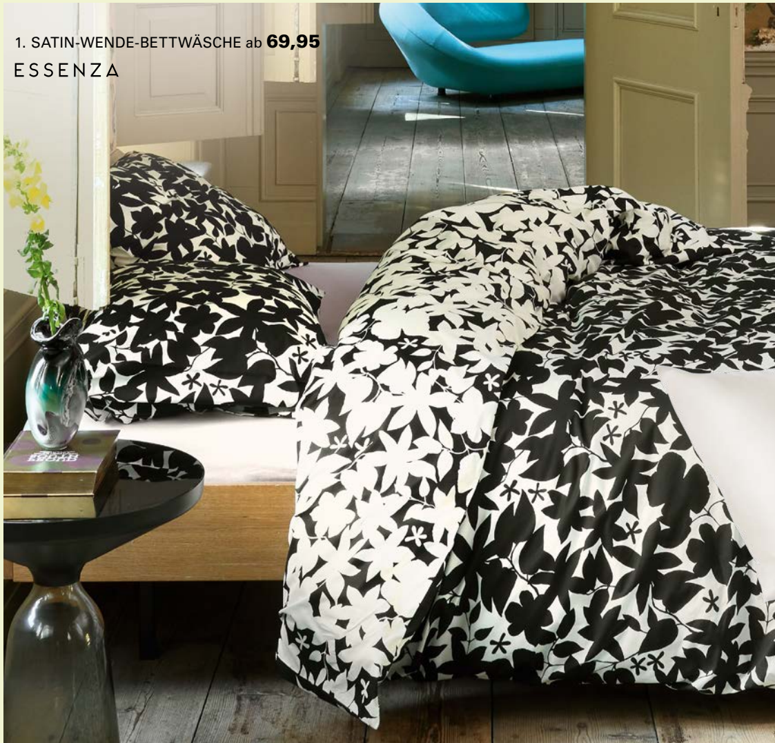
1. SATIN-WENDE-BETTWÄSCHE ab 69,95 ESSENZA