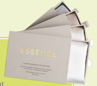
3. SEIDEN-SCHLAFMASKE 29,95 IN EDLER GESCHENKBOX ESSENZA