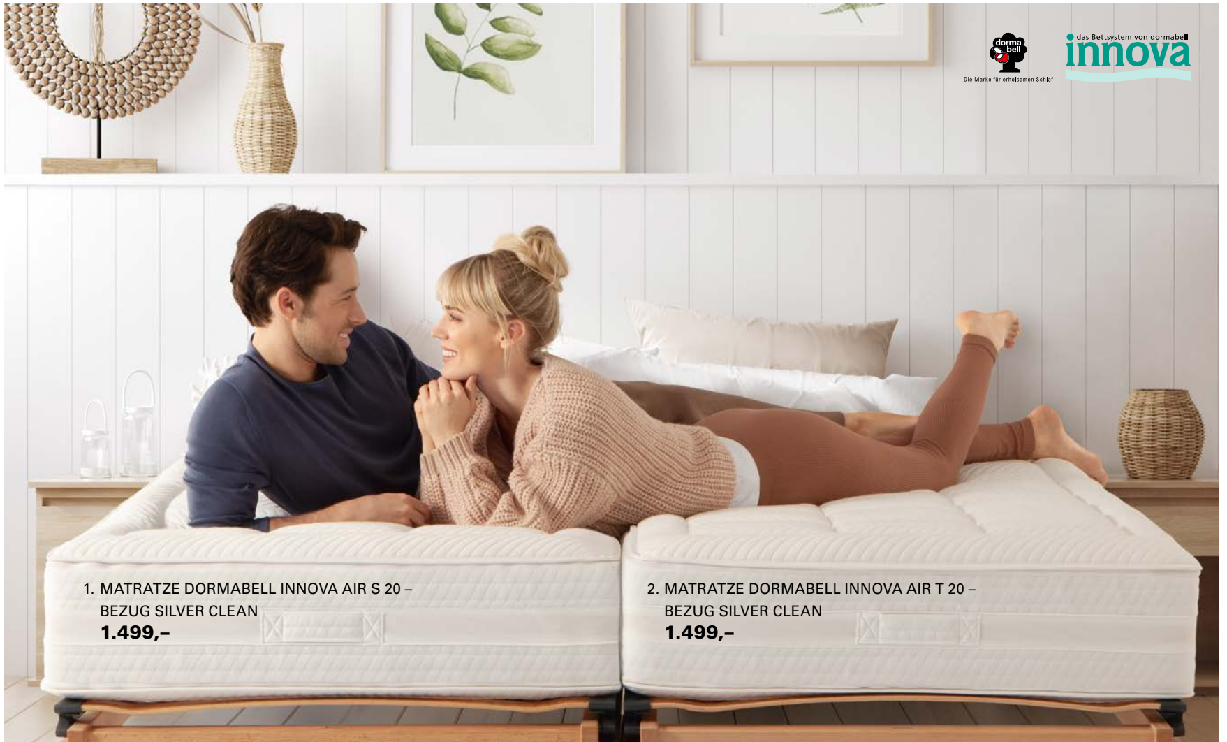
1. MATRATZE DORMABELL INNOVA AIR S 20 – BEZUG SILVER CLEAN 1.499,-

Matratze ist ein Bett nur halb so bequem. Der Körper sollte sanft einsinken können, aber auch ideal gestützt und getragen werden. Für individuellen Wohlfühlkomfort sind Matratzen von dormabell Innova in mindestens drei Festigkeitsstufen mit verschiedenen Bezügen und optional mit Topper erhältlich.