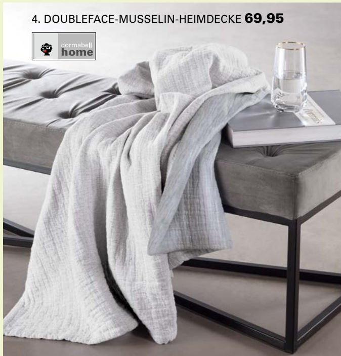
4. DOUBLEFACE-MUSSELIN-HEIMDECKE 69,95