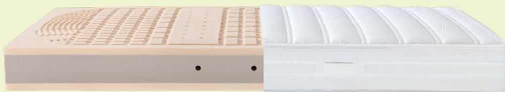
4. MATRATZE DORMABELL INNOVA AIR T 18 – BEZUG SILVER CLEAN 1.199,-