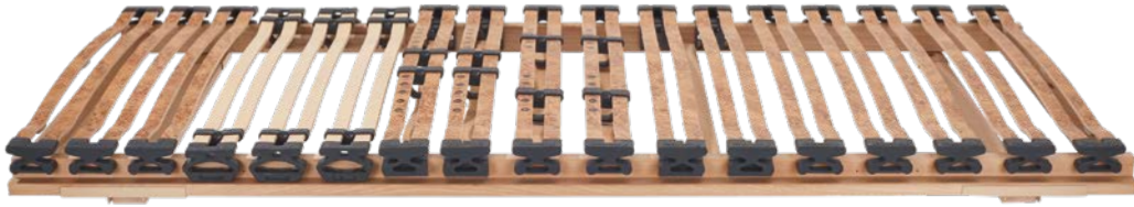
5. RAHMEN DORMABELL INNOVA N 649,-