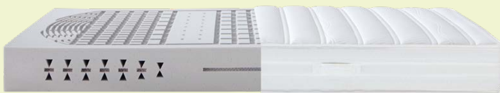
3. MATRATZE DORMABELL INNOVA AIR S 18 – BEZUG SILVER CLEAN 1.199,-