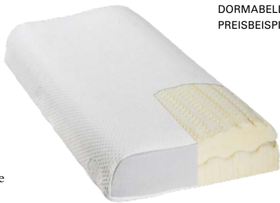
7. NACKENSTÜTZKISSEN DORMABELL CERVICAL PREISBEISPIEL: NB 4 139,95

WELCHES CERVICAL KISSEN ZU IHNEN PASST, ZEIGT DER KISSENBERATER AUF dormabell-cervical.de