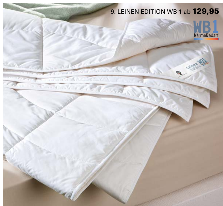
9. LEINEN EDITION WB 1 ab 129,95